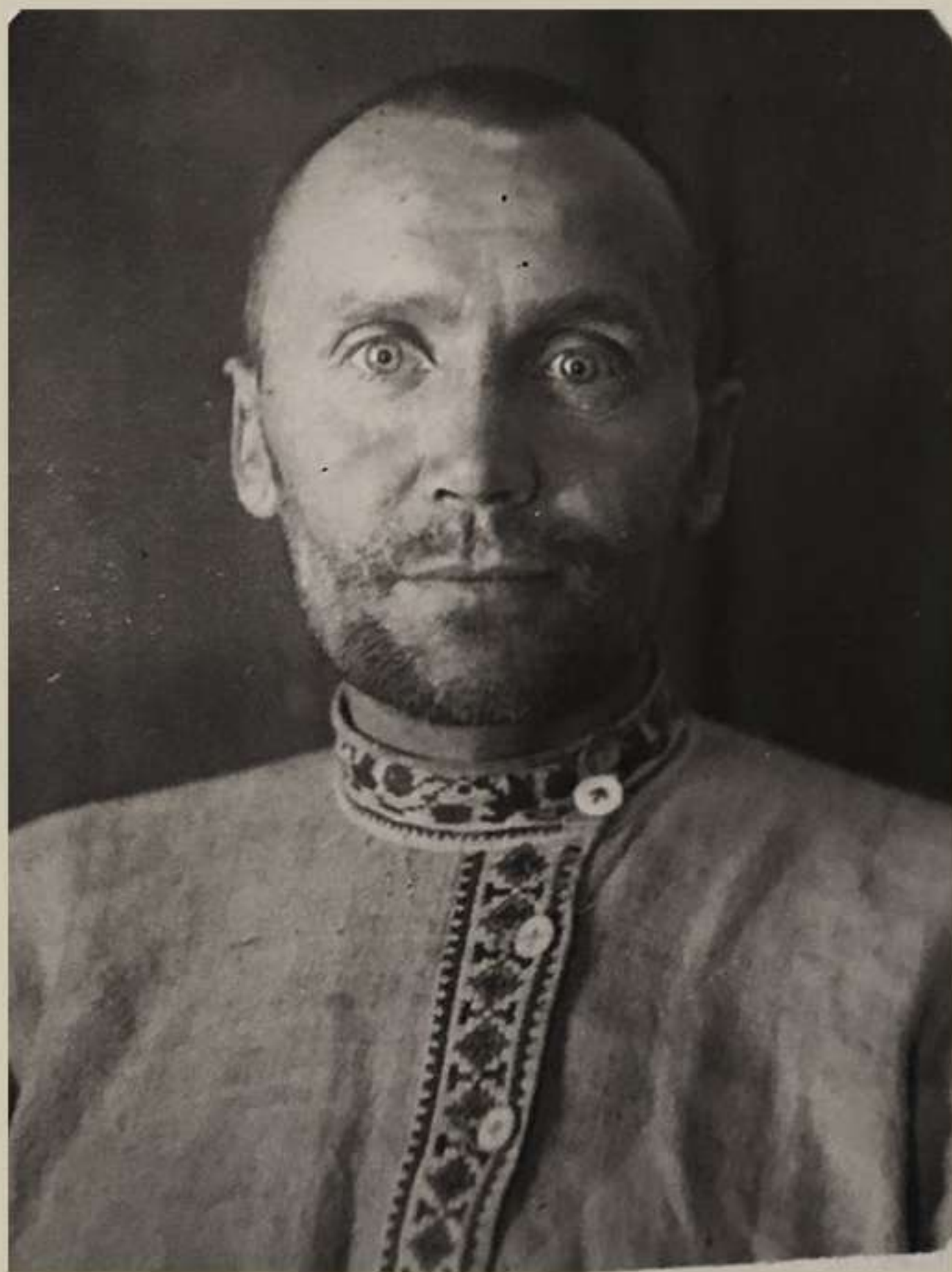
Федір Лазарчик-Буряк (1895 – 1937)