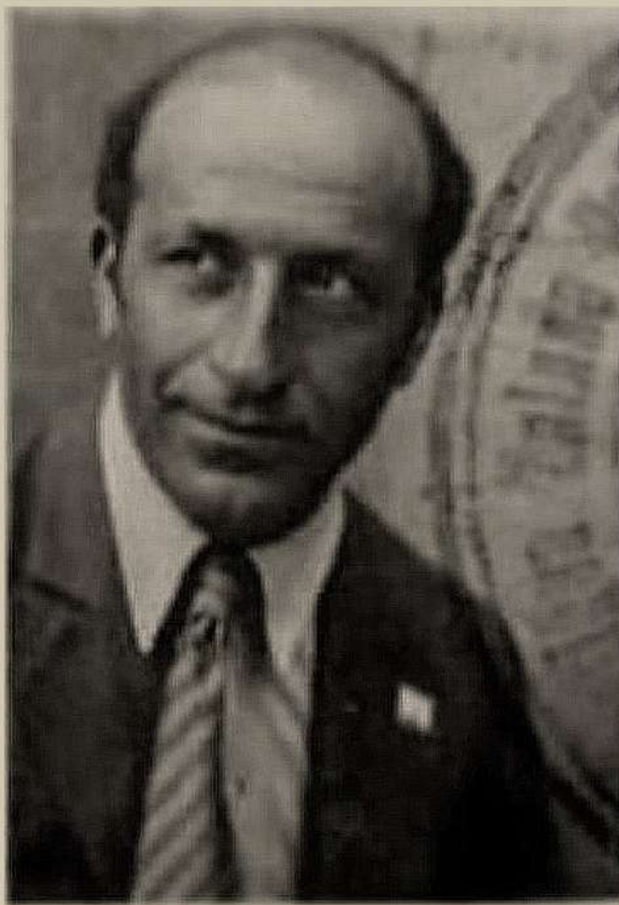
Генрі Парло (1898 – 1937)