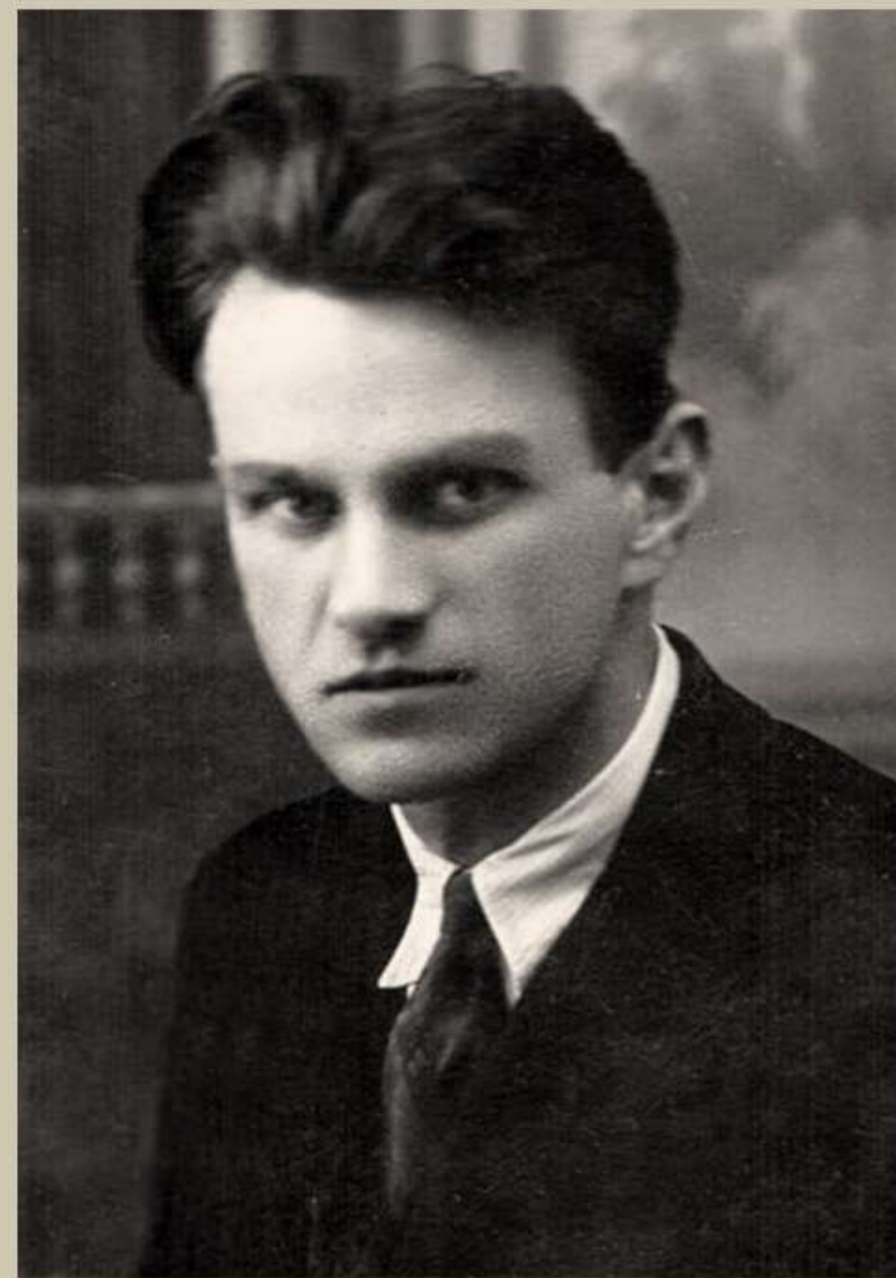
Юрій Вухналь (1906 – 1937)