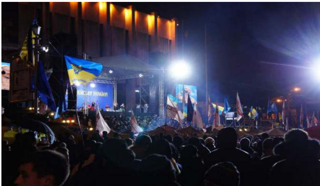
Політична опозиція на Європейській площі.

Ближче до вечора на Європейській площі постало наметове містечко прихильників євроінтеграції. Комендантом містечка було обрано Андрія Парубія. Силовики намагалися «зачистити» табір мітингувальників, почалися сутички, під час яких правоохоронців відтіснили до готелю «Дніпро».