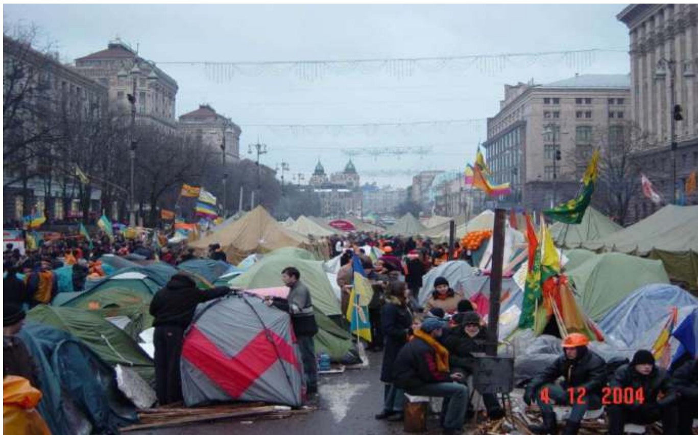
Побут протестувальників у наметовому містечку на Хрещатику.

Позачергова сесія Київської міської ради висловила недовіру Центральній виборчій комісії (ЦВК) та звернулася до Верховної Ради з проханням не визнавати попередні результати підрахунку голосів. Одночасно Київрада зобов'язала Київську міську державну адміністрацію забезпечити належні умови для проведення масових акцій у Києві та охорону громадського порядку. Того самого дня ще до оголошення офіційних результатів голосування президент росії володимир путін привітав Віктора Януковича з перемогою.