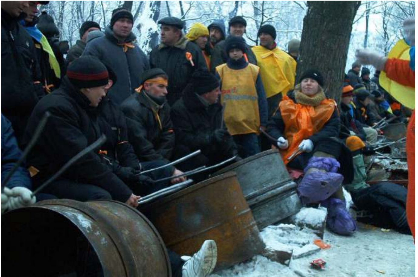
Барабанщики Помаранчевої революції.

Оригінальним виявом творчого духу Майдану стали «барабанщики революції» – група людей, які навпроти будівлі Кабінету Міністрів України стукали в металеві бочки, що залишилися в Маріїнському парку після мітингів прихильників Януковича.