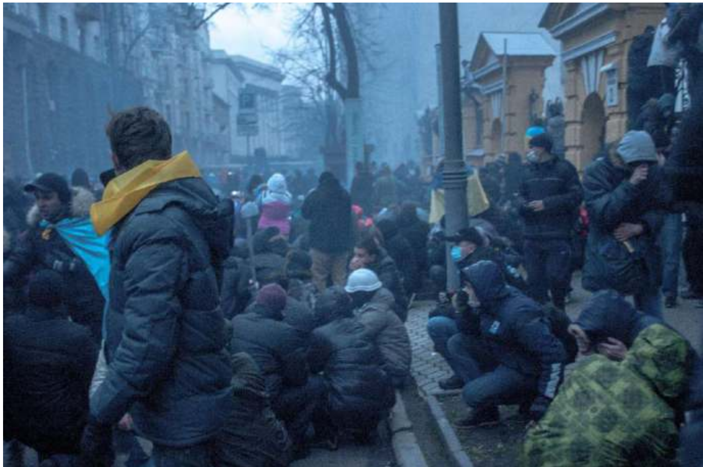
Вулиця Банкова 1 грудня 2013 року.

Цього ж самого дня протестувальники зайняли приміщення Київської міської ради та Будинок Федерації профспілок України, де розмістився новостворений Штаб національного спротиву. Рух Хрещатиком було перекрито. Там постало наметове містечко.