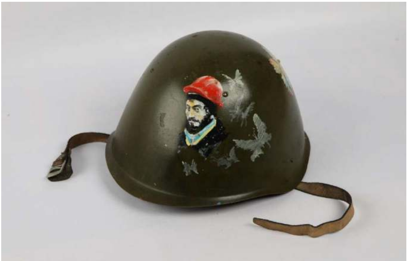
Майданівська каска з портретом Героя Небесної Сотні Сергія Нігояна.

Серед основних символів Майдану – стрічки з кольорами прапорів України та Європейського Союзу, каски та щити членів Самооборони Майдану, що не могли захистити від куль, а радше сприймалися як суто символічні засоби захисту чи як обереги. Невипадково значну кількість щитів і касок було розписано або вкрито написами.