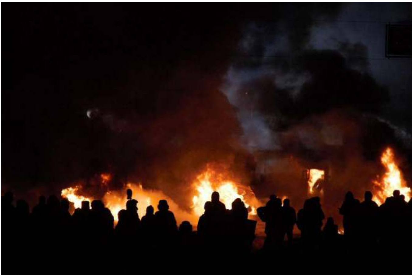
«Вогнехреща» на Грушевського.

Ухвалення «диктаторських законів», зміст яких відверто суперечив принципам демократії, призвело до радикалізації протестів. На черговому вічі 19 січня 2014 року частина його учасників, обурена згаданими законами та бездіяльністю опозиційних лідерів, вирушила до будівлі Верховної Ради. На початку вулиці Михайла Грушевського шлях їм перекрили міліція та «Беркут». Майже відразу почалися сутички. Лінія протистояння пролягла між колонадою стадіону «Динамо» та будівлею Національного художнього музею України. Міліція застосувала світлошумові гранати й інші спецзасоби. Із боку протестувальників полетіли петарди та «коктейлі Молотова». Два міліцейські автобуси, які перекривали шлях колоні, було перекинуто та спалено. Щоб стримати спроби наступу силовиків, протестувальники склали з підпалених шин вогняну барикаду. Утворилася щільна димова завіса. Міліція вдалася до помпових рушниць і водометів у супереч закону, який забороняє використовувати водомети за температури нижчої від нуля градусів за Цельсієм. Цей і наступні дні протистояння на вулиці Михайла Грушевського увійшли в історію під назвою «Вогнехреща».