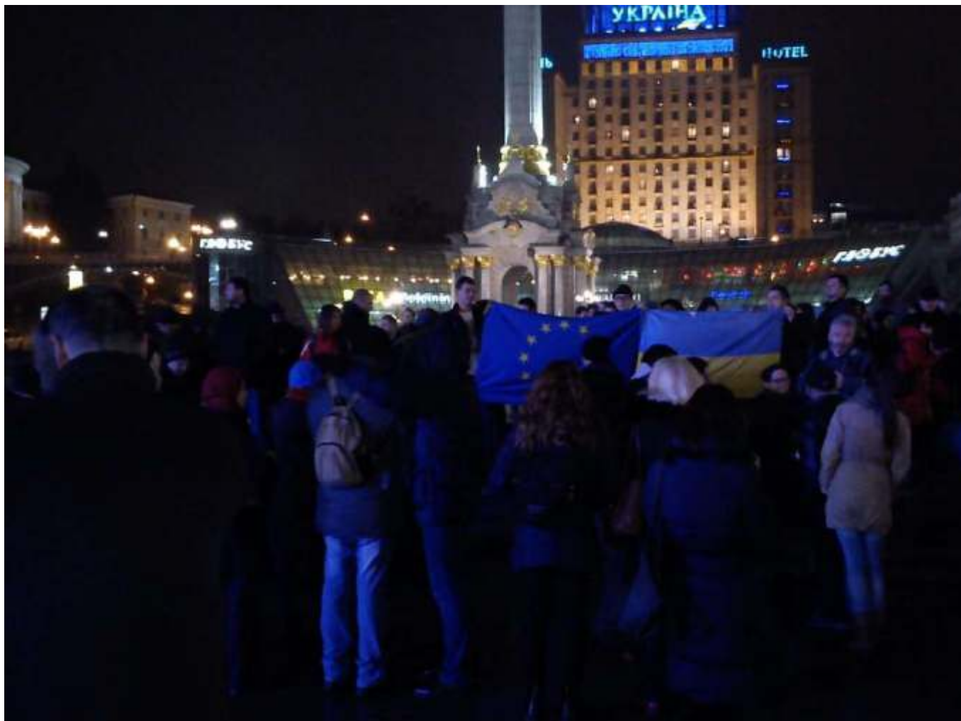
Початок Євромайдану. 21 листопада 2013 року.

За інформацією «Української правди», ближче до півночі на головній площі Києва зібралось близько 1500 осіб із прапорами України та Євросоюзу. Від майдану Незалежності вони вирушили на вулицю Банкову, яку заблокували силовики. Заспівавши гімн України під Адміністрацією президента, люди повернулися на центральну площу. Частина з них залишилася на майдані Незалежності до ранку, тим самим заявивши, що протест буде безстроковим. Маніфестантів підтримали деякі опозиційні політики, які також вирішили чергувати вночі на Майдані з метою захисту протестувальників.