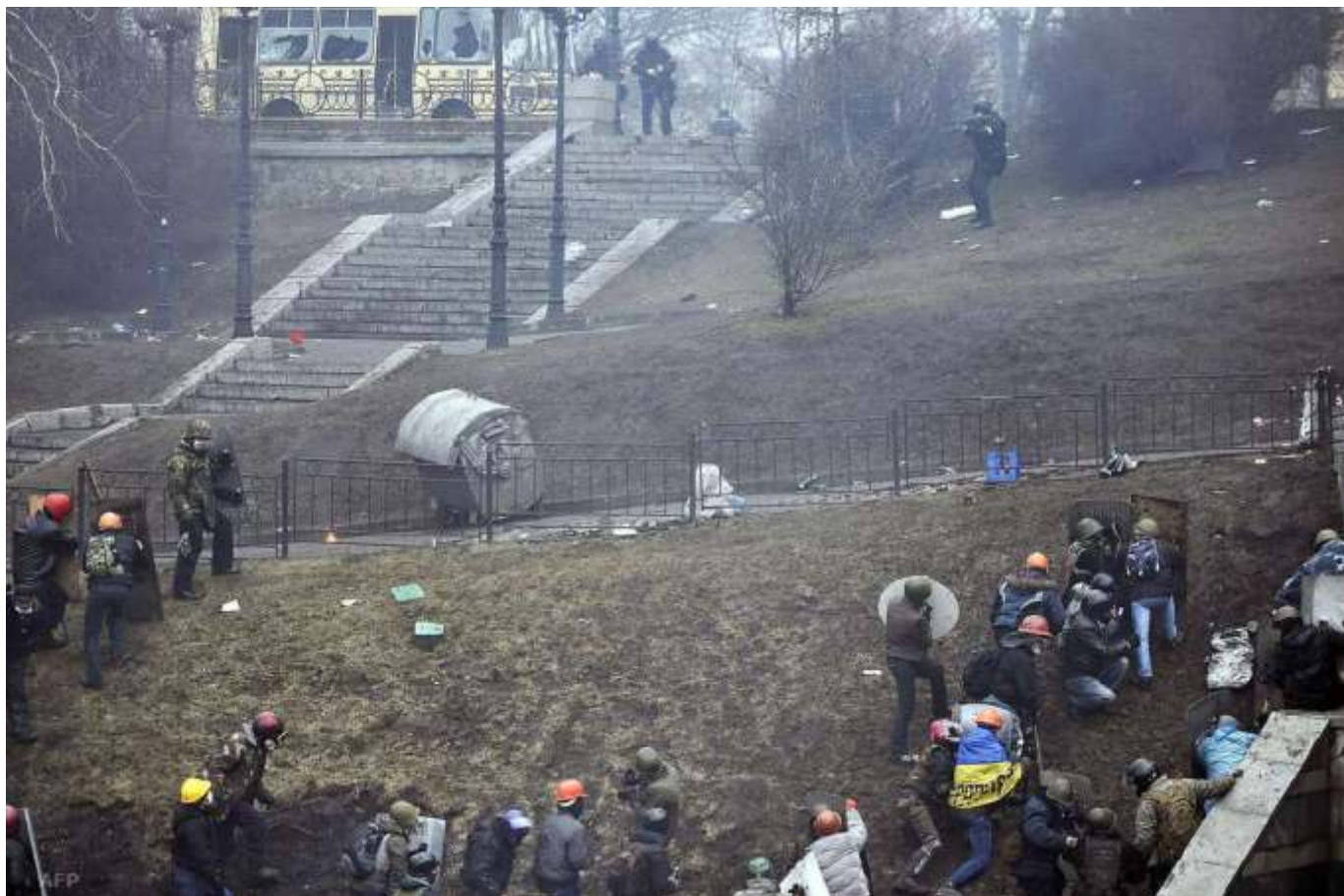
Наступ майданівців на вул. Інститутській.

Протестувальники відтіснили силовиків до Міжнародного центру культури і мистецтв Федерації профспілок України (Жовтневого палацу). Після цього, за інформацією, оприлюдненою в рішенні суду щодо розстрілів 20 лютого 2014 року учасників масових протестів, заступник командира полку «Беркуту» Олег Янішевський прийняв рішення застосувати силу проти активістів, щоб звільнити майданчик біля Жовтневого палацу та прикрити відступ силовиків, які перебували у будівлі. Бійці так званої чорної роти «Беркуту» відкрили вогонь на ураження проти беззбройних людей.