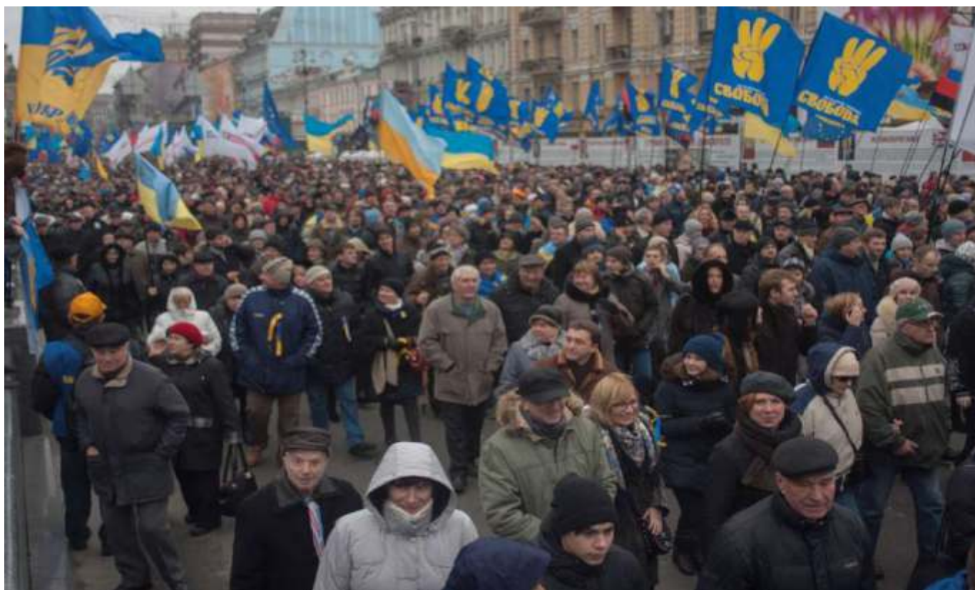
Учасники маршу 1 грудня 2013 року.

1 грудня спершу на Михайлівській площі, а потім біля пам'ятника Тарасові Шевченку в Києві почали збиратися тисячі людей. Звідти колони учасників акції маршем рушили до майдану Незалежності. За різними даними, участь у марші взяли від 500 тисяч до 1 мільйона осіб з усієї України.