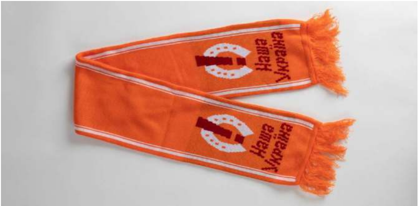
Шарф учасника Помаранчевої революції. Із фондів НМРГ