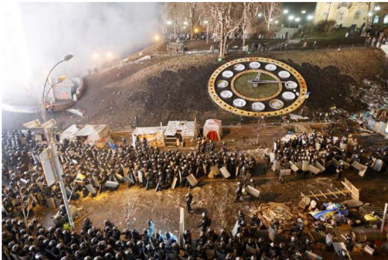
Штурм Майдану. Вечір 18 лютого 2014 року.