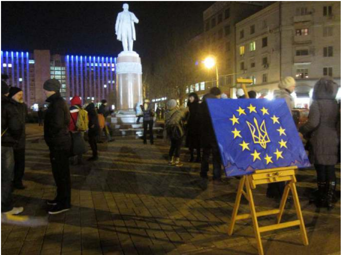
Євромайдан у Донецьку. 25 листопада 2013 року.

Акції з вимогою підписати Угоду про асоціацію з ЄС відбулися також у багатьох країнах світу, де жили українці. Зокрема українська діаспора Італії, Франції, Німеччини, Великої Британії, Чехії, Польщі, США та Канади 23–24 листопада організувала мітинги, на яких люди висловлювалися на підтримку Євромайдану та виступали за укладення Угоди про асоціацію.