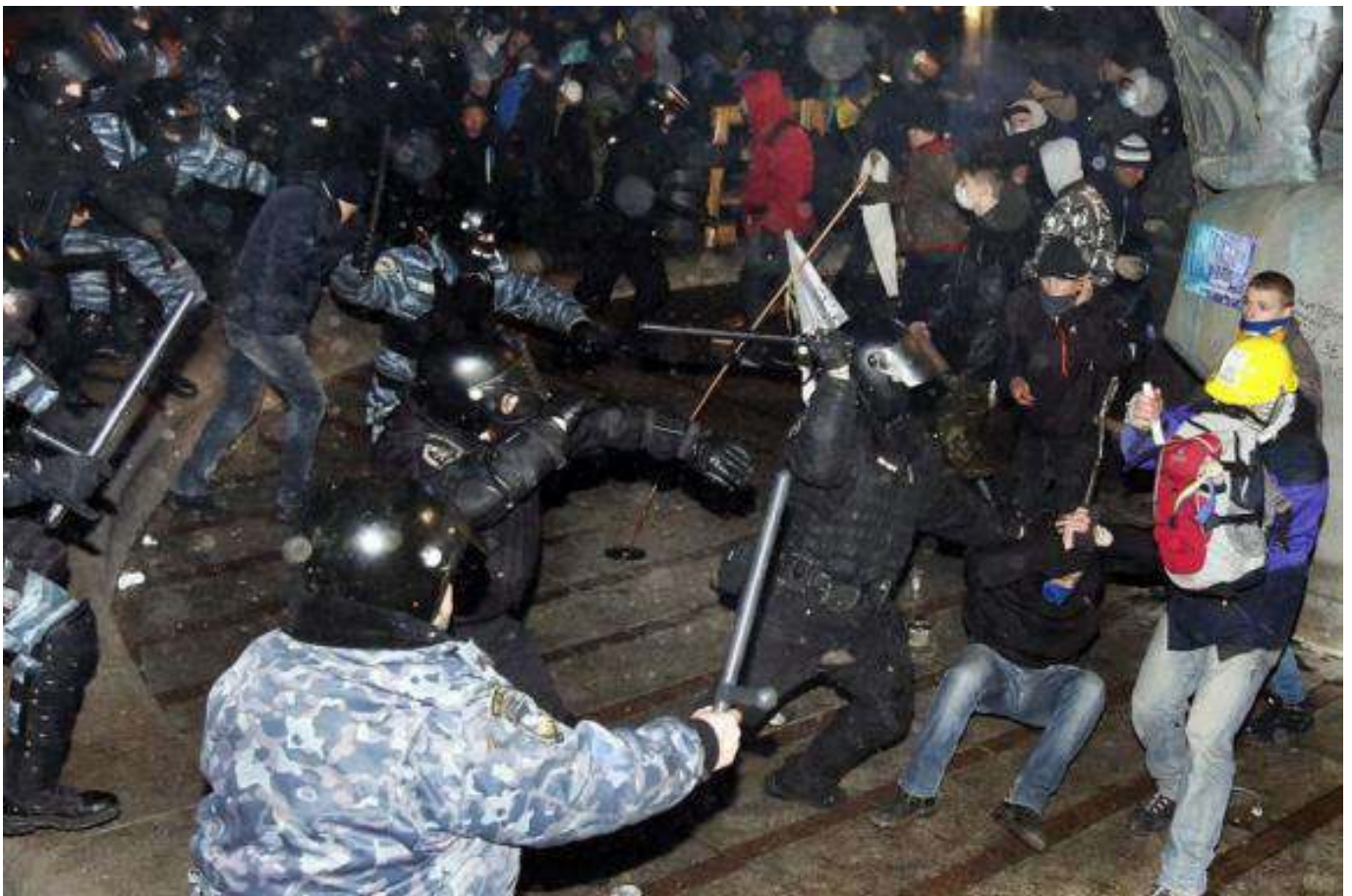
Побиття мітингувальників біля монумента Незалежності в ніч на 30 листопада 2013 року.

Офіційною причиною розгону Євромайдану назвали підготовчі роботи з установлення традиційної новорічної ялинки в центрі Києва.