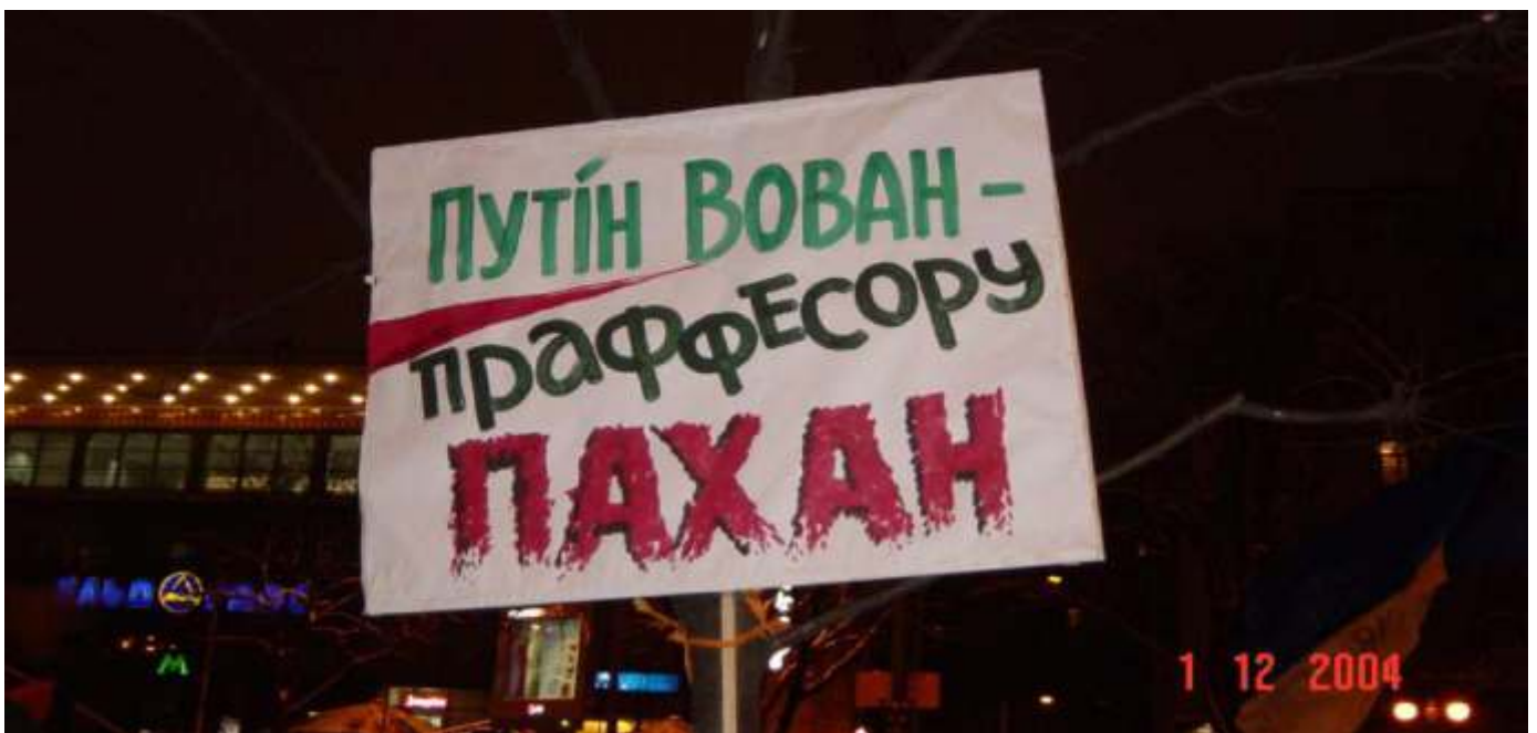
Плакат Помаранчевої революції.

Хоча Помаранчевий майдан не мав відверто антиросійського характеру, чимало його учасників усвідомлювали, в чиїх інтересах перемога Януковича та яке майбутнє може очікувати Україну, якщо він стане чільником держави. Тому серед агітаційних плакатів можна зустріти ті, які прямо вказували на російський вплив, помітний у риторичній діяльності Януковича та його прибічників.