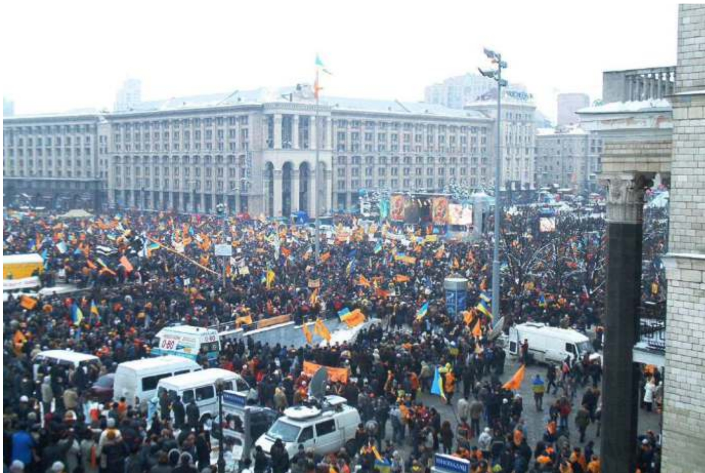
Помаранчевий майдан.