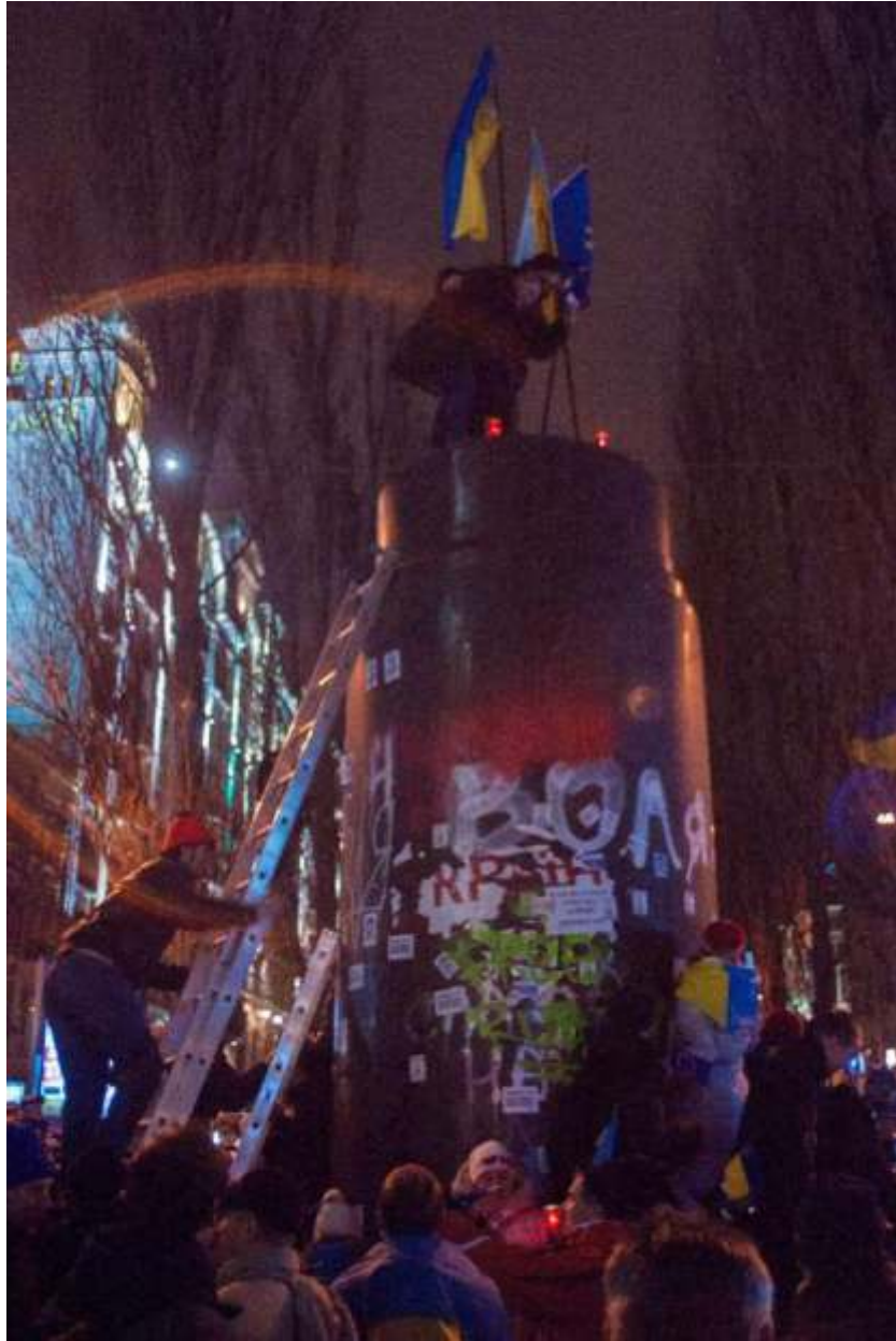
Так починався «ленінопад».

10 грудня було ініційовано перемовини у форматі круглого столу між В. Януковичем та представниками політичної опозиції. Роль умовних арбітрів мали відіграти попередники Януковича на президентській посаді – Леонід Кравчук, Леонід Кучма та Віктор Ющенко.