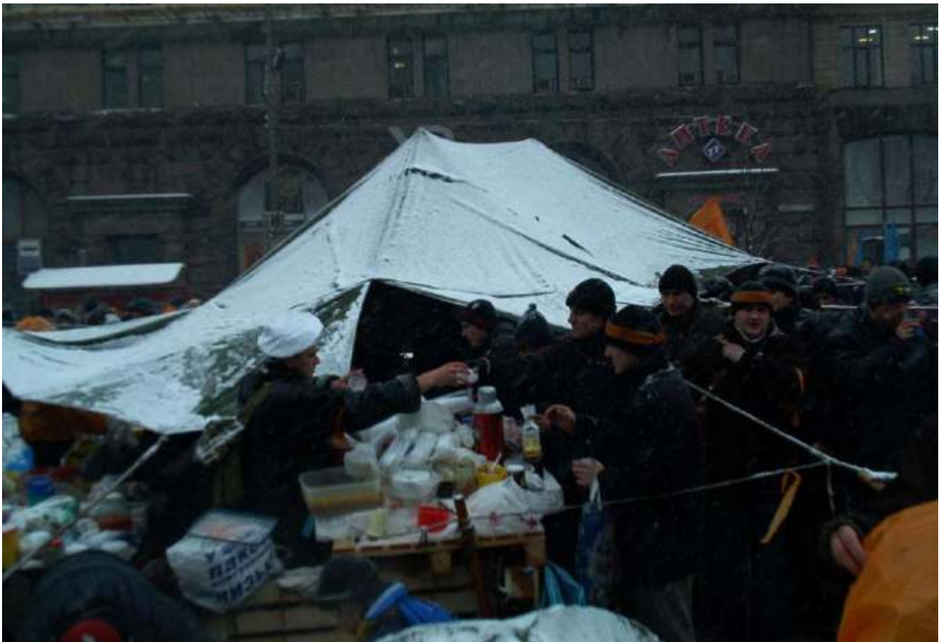
Кухня на Майдані.

Серед громадських ініціатив одну з провідних ролей під час Помаранчевої революції відіграла організація «Пора!», утворена ще на початку 2004 року з метою контролю виборчих процесів.