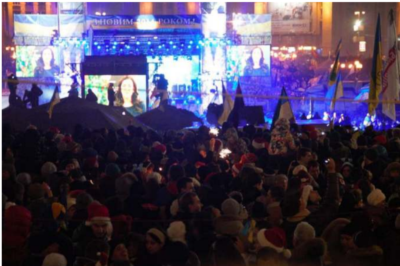
Новий рік на майдані Незалежності.

16 січня у Верховній Раді переважно силами депутатів від Партії регіонів і комуністів ухвалили пакет законів, які суттєво обмежували права громадян на протест. Суспільство відразу охрестило їх «диктаторськими». Ці закони, спрямовані проти фундаментальних громадянських свобод – свободи вияву поглядів, мирних зібрань, об'єднань, цілковито звільняли від відповідальності причетних до кривавих подій на Євромайдані та створювали правові підстави для запровадження цензури й переслідування незгодних із діями влади.