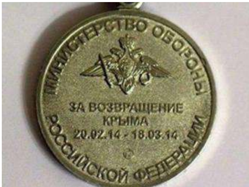
Медаль министерства обороны росії «За повернення Криму. 20.02.14 – 18.03.14»

Проте відлуння Майдану виявилось потужним: намірам росіян окупувати Кримський півострів намагалися перешкодити кримськотатарські та українські активісти. 26 лютого на ініціативу Меджлісу в Сімферополі перед будівлею Верховної Ради АР Крим відбувся мітинг, до якого приєдналися проукраїнські активісти. Їм удалося заблокувати будівлю та завадити проросійським депутатам зібрати кворум і легалізувати російську окупацію. Однак у ніч на 27 лютого будівлю кримського парламенту захопили російські військовики без розпізнавальних знаків. Почався процес «легалізації» російської окупації, який закінчився псевдореферендумом 18 березня 2014 року та анексією Криму.