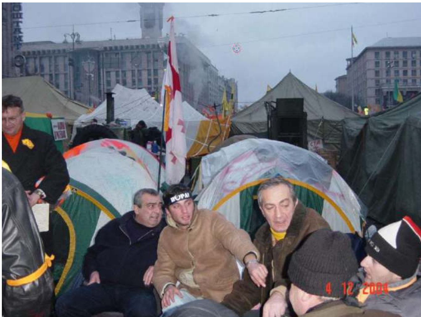
Активіст «Пори» у наметовому містечку.