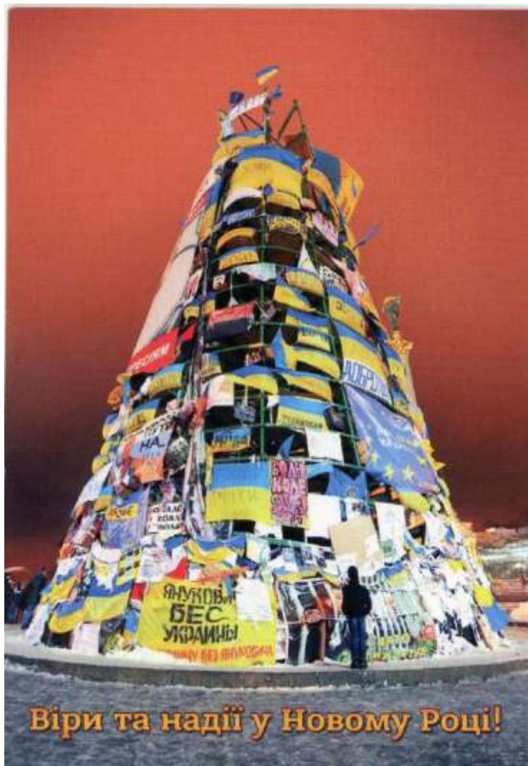
Новорічна листівка з майданівською ялинкою.

До загострення ситуації у січні 2014 року символом Майдану як місця, де збиралися культурні й освічені люди, європейці за духом, було піаніно Майдану . Його ставили перед силовиками, а відчайдушні музиканти виконували на ньому різні музичні композиції.